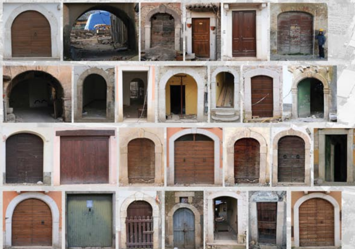
Alcuni esempi di porte e portali onnesi