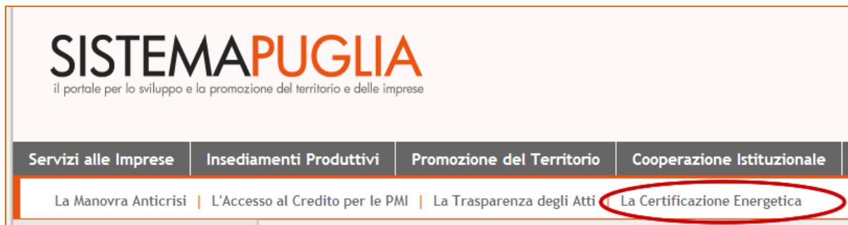
Figura 1 - Punto di accesso alla sezione La Certificazione Energetica

La procedura è disponibile nella pagina La Certificazione Energetica - link posto nella barra di menu orizzontale di secondo livello della home del portale.