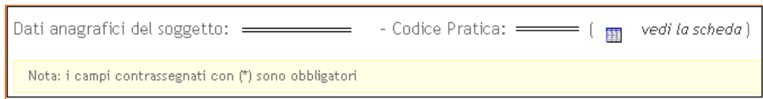
Figura 5 - Modalità Visualizzazione

Il tasto per passare alla modalità Modifica di una pratica è visibile solo se la procedura di compilazione della pratica non si è conclusa con la generazione del pdf definitivo.